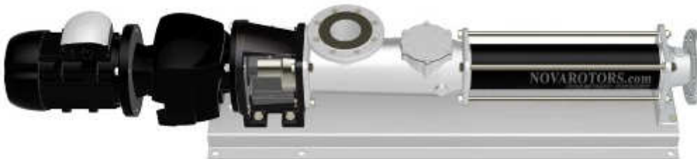
DN Pompa industriale flangiata per pompaggio pasta d'olio per la lavorazione nelle varie fasi d'impianto.

Le pompe monovite Nova Rotors sviluppate seguendo in modo rigoroso le più severe normative in ambito sanitario, garantiscono elevati standard di qualità, affidabilità e durata, dando il meglio in tutto il processo di produzione. In particolare si è prestata particolare attenzione ad ogni passaggio da una fase di lavorazione alla successiva, mettendo a disposizione varie forme costruttive con lo scopo di ottimizzare ogni trasferimento.